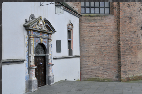
Caspar-Olevian-Saal an der Konstantin-Basilika

Gottesdienst zum Weltkulturerbetag in der Konstantin-Basilika, Trier, Geschichte der Basilika mit Schwerpunkt Reformation, anschließend Führungen, Vortrag